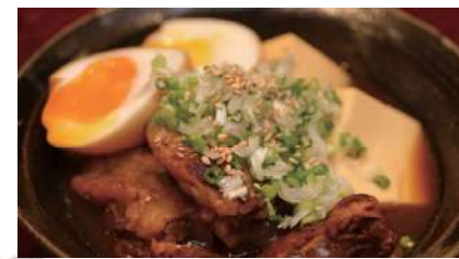
煮込み 大 980円 (玉子付+180円) 小 680円