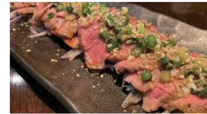
極上ヒレ肉たたき 1,680円