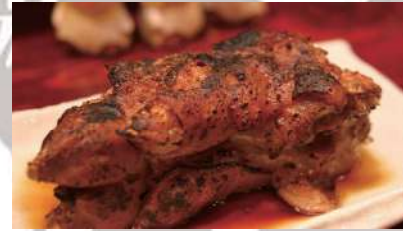
まるごと豚足 980円 ハーフサイズ 680円