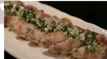
豚トロさっぱり焼き 980円